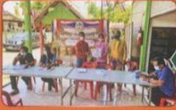
▲ นายก อบต.หนองน้ำใส ร่วมมอบพันธุ์พืชผักสวนครัวที่ได้รับจากหน่วยงานบ้านโน้ ตามโครงการปลูกผักสวนครัวเพื่อใช้ในครัวเรือนของสำนักงานพัฒนาชุมชนตำบลบ้านโน้