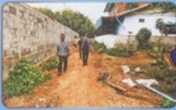
▲ นายก อบต.หนองน้ำใสขอพื้นที่ร่วมกับนิติกร อบต.หนองน้ำใส และนายทองทุน จำปาดี ผู้ใหญ่บ้านหนองบกเขื่อน ติดตามแก้ไขปัญหาน้ำท่วมขังบริเวณเหนือหน้าศาลเจ้าอยู่หัว การนพรัตน์ โดยมีการขุดคูระบายน้ำจากถนนด้วยเครื่องขุดมือ อีกฝ่ายก็ทำระบบน้ำประปา อีกฝ่ายก็เดินรถไถจากกลุ่มวิสาหกิจ อบต.หนองน้ำใสเพื่อหาทางออกด้วยดีด้วยความพอใจ ทั้งสองฝ่าย