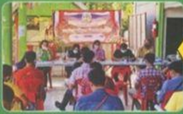
▲ นายก อบต.หนองน้ำใส ร่วมประชุมกับนิติกร อบต.หนองน้ำใสและผู้นำชุมชน ที่บ้านหนองน้ำใส