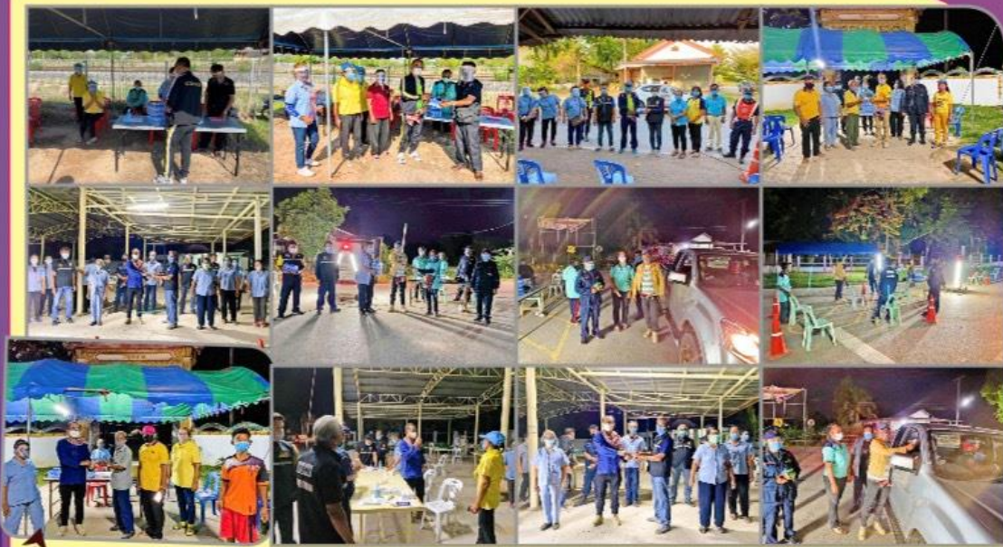
สนับสนุนการตั้งจุดตรวจคัดกรองเฝ้าระวังการระบาดของโรคติดต่อไวรัสโคโรนา โควิด 19 องค์การบริหารส่วนตำบลหนองน้ำใส สนับสนุนอุปกรณ์ เช่น หน้ากากอนามัย หน้ากากผ้า หน้ากากเฟซซิล เจลล้างมือ น้ำดื่ม เป็นต้น ให้กับผู้ปฏิบัติงานจุดตรวจป้องกันและเฝ้าระวังการระบาดของโรคติดต่อไวรัสโคโรนา โควิด 19 ในเขตตำบลหนองน้ำใส