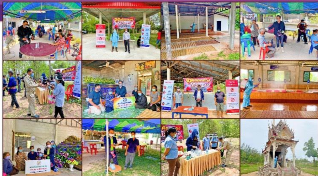
อบต.หนองน้ำใส ร่วมกันช่วยสนับสนุนการจัดงานฅาปนกิจศพในเขต อบต.หนองน้ำใส ตามประกาศกระทรวงวัฒนธรรม เรื่องแนวทางการปฏิบัติเกี่ยวกับเทศกาล ประเพณี พิธีทางศาสนา และพิธีการต่างๆ กรณีการแพร่ระบาดของโรคติดเชื้อไวรัสโคโรนา 2019 (COVID-19) โดยจัดให้มีจุดคัดกรองตรวจวัดไข้ผู้เข้าร่วมงาน จัดให้มีการลงทะเบียน หรือบันทึกภาพผู้เข้าร่วมงาน จัดให้มีแอลกอฮอล์เจลบริเวณจุดทางเข้างาน ทำความสะอาดอุปกรณ์และพื้นที่บริเวณจัดงาน ที่ผู้เข้าร่วมงานต้องสัมผัสบ่อยๆหรือที่ใช้ร่วมกันเป็นจำนวนมาก รวมทั้งพื้นที่โดยรอบการจัดงาน จัดให้ผู้เข้าร่วมงานสวมหน้ากากอนามัยทุกคน เว้นระยะห่างในการนั่ง ๒ เมตร จัดอาสนะสงฆ์ มีระยะห่าง ๑-๒ เมตร จัดระยะห่างระหว่างผู้ขึ้นวางดอกไม้จันทน์ ไม่น้อยกว่า ๒ เมตร