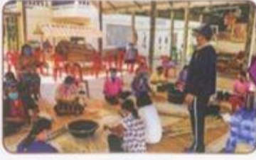
▲ นายก อบต.หนองน้ำใส เยี่ยมให้กำลังใจ มอบหน้ากากอนามัย เจลล้างมือ น้ำดื่ม และให้ความรู้เรื่องการป้องกันการระบาดของโรคโควิด 19 และเรื่องแหล่งเงินทุนการชุกชุม กับกลุ่มแม่บ้านที่จากต้นกบ บ้านนาโน